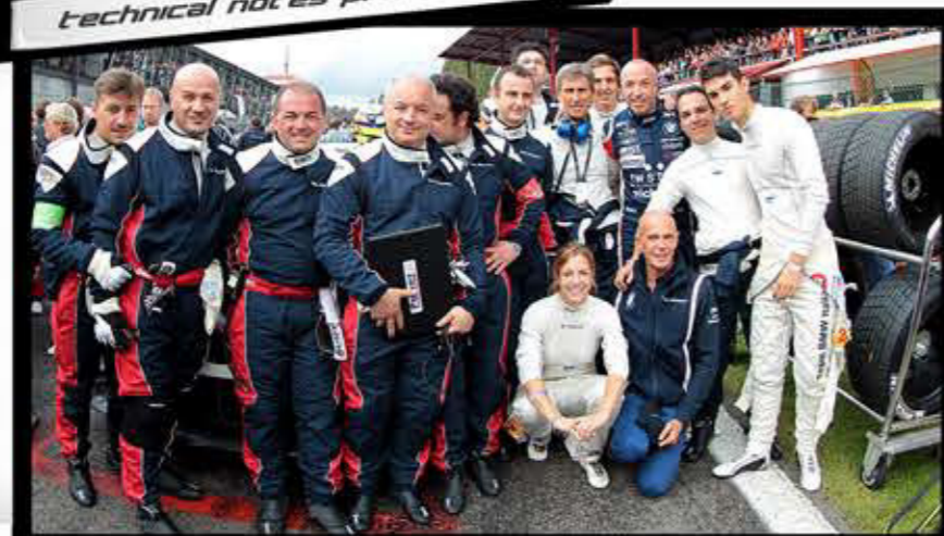
un sorriso per la stampa ...