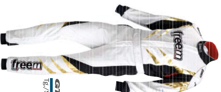
GTK 81 TEAM MetalSkin Tg./Size: 44-64