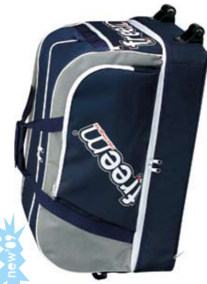
BIG ROLL LT 120