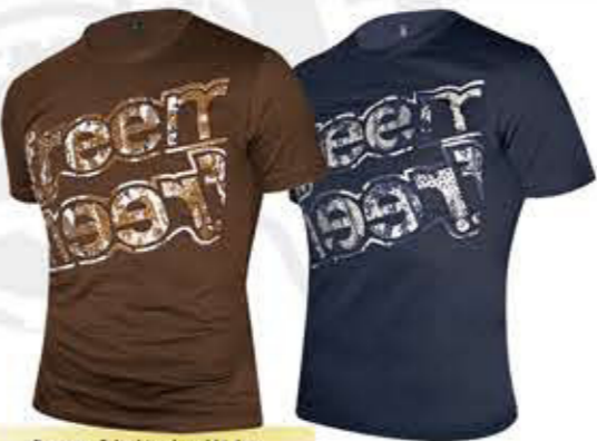
Altri colori disponibili dal 2013 / New colors available in 2013