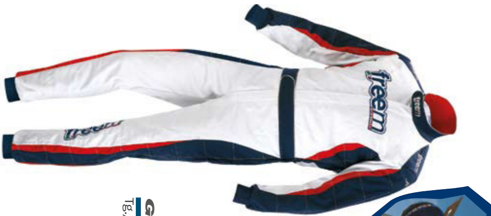
GTK 810 RACE Tg./Size: 44-64