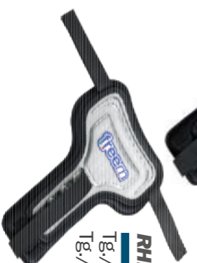
RHINO ALUMINUM FLASH Tg./Size: 1-2-3 uomo/man Tg./Size: K-0 bambino/kid