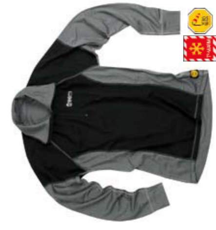
UNDER CAW Tg./Size: S -XL