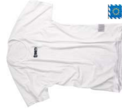
UNDER SD Tg./Size: S -XL