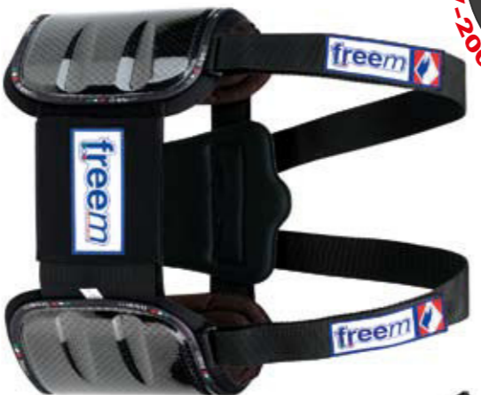
BRAVE CARBON RC Tg./Size: 1-2-3 uomo/man