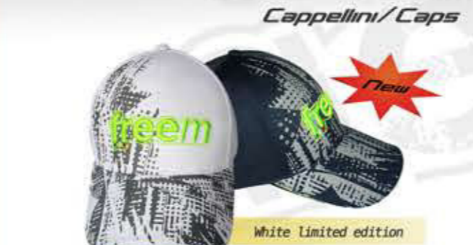
Personalizzabile con il nome / Customizable with the name