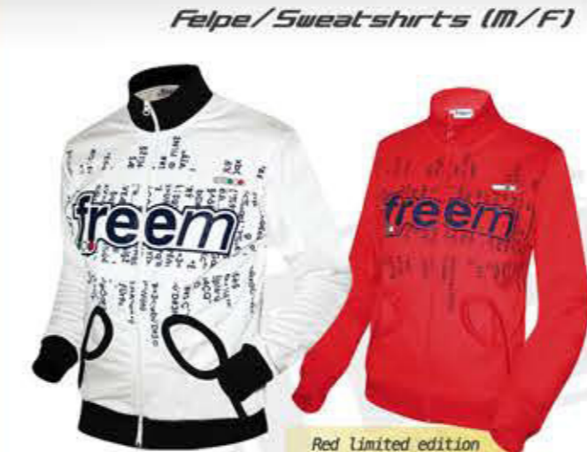
Altri colori disponibili dal 2013 / New colors available in 2013