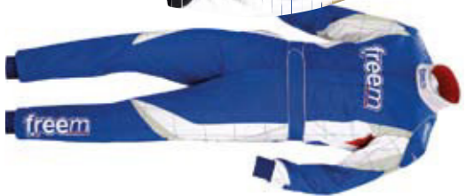
GTK 81 TEAM Tg./Size: 44-64