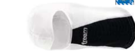
OPEN FACE SD Tg./Size: S -XL