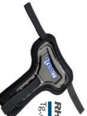
RHINO CARBON RC Tg./Size: 1-2-3 uomo/man