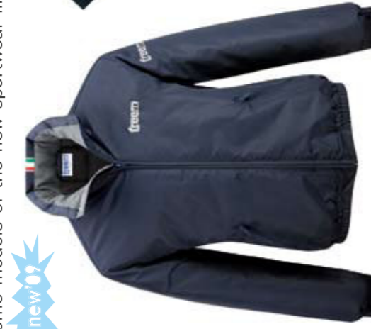
GTB 80 B RACE Tg./Size: XS -XXL