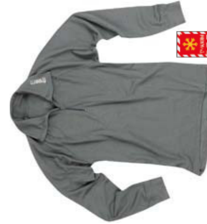
UNDER CZ Tg./Size: S -XL