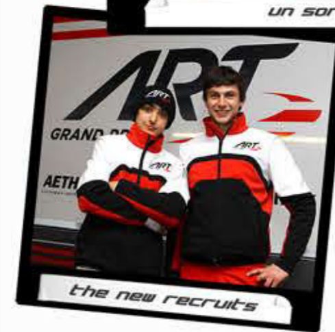
the new recruits