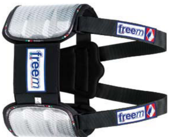
BRAVE ALUMINUM FLASH Tg./Size: 1-2-3 uomo/man Tg./Size: K-0 bambino/kid