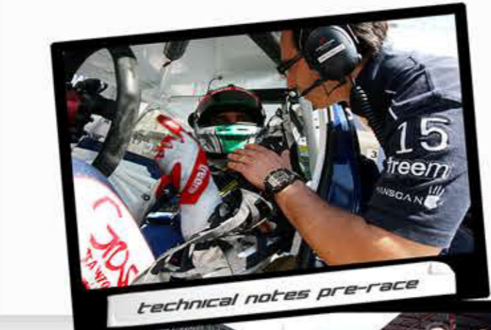
technical notes pre-race